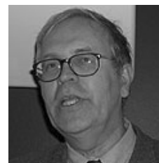
Peter von Bagh.

Von Baghin tärkeimpänä viestinä oli huomata se tosiseikka, etteivät elokuvat sinänsä ole historiaa, vaan olennaista on huomata esim. 1930-luvulla tehdyn elokuvan heijastus teko hetken ajasta. Se on tiedostamatonta dokumenttia.