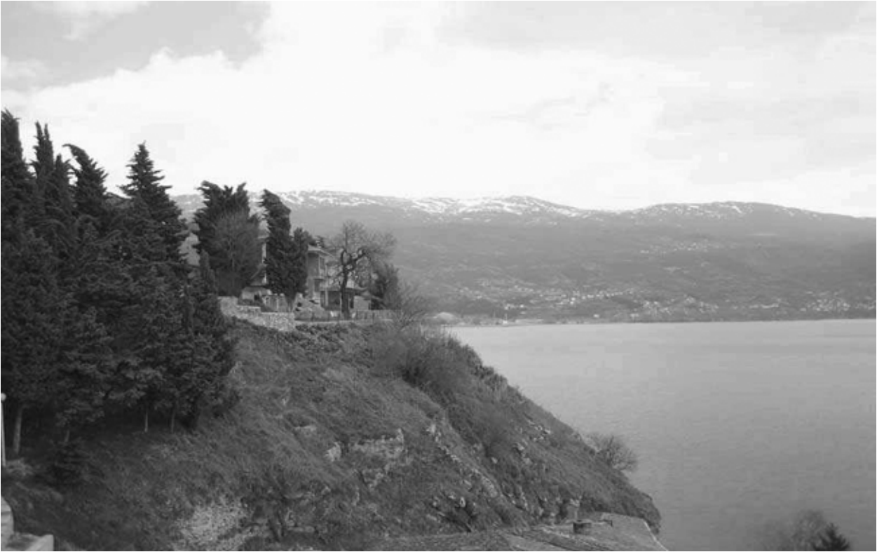
Ohrid-järven rantamaisemia konferenssikaupungista.