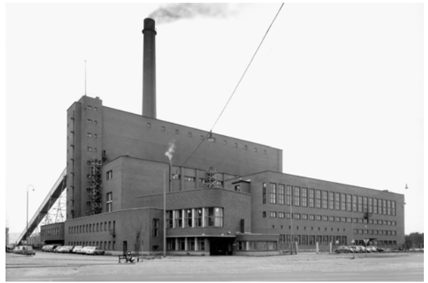
Salmisaaren voimala vuoden 1961 mallissaan.