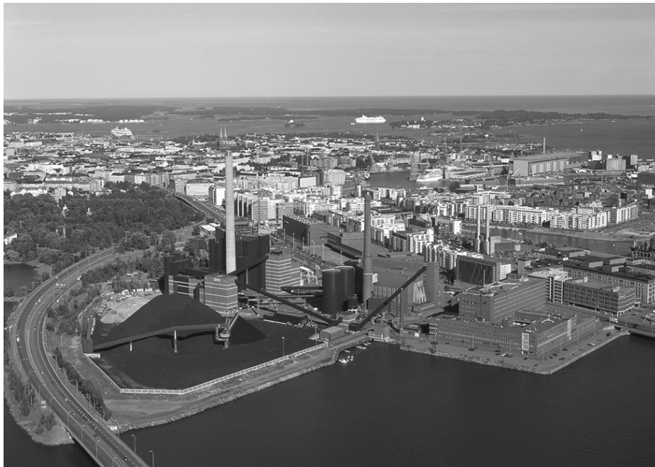
Salmisaaren voimala Helsingissä sijaitsee turkulaisittan varsin kotoisasti Oikeustalon ja Hesburgerin välissä.