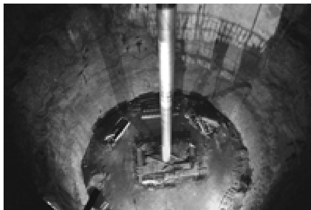
Salmisaaren maanalainen kivihiilivarasto on ensimmäinen laatuaan maailmassa. Varastossa on neljä pystysiltoa, joiden halkaisija on 40 ja korkeus 65 metriä.

saimme kuulla muun muassa Salmisaaren kattilan olevan tyyppiä luonnonkiertohöyrykattilanurkkapoltolla . Infohetkemme jälkeen pääsimme vielä kiertokäynnille voimalaitokseen, jossa itselleni ehdoton huippuhetki oli valvomo. Monine nippeleineen ja nappuloineen kun tämä