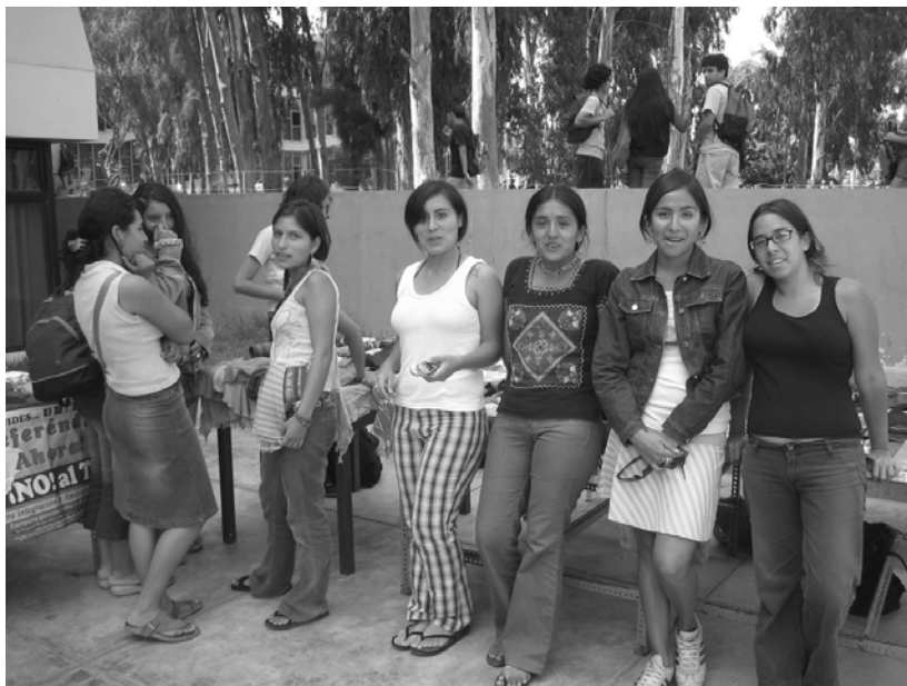
Acción Global, Global Action Week, teki San Marcosissa tunnetuksi mm. reilua kauppaa. Ja näiden mimmien myyntipöytiä.

Kurssit kannattaa valita huolellisesti ja kysellä niin monelta kuin kehtaa. On nimittäin professoreita, jotka eivät koskaan muista tulla luennolle ja toisia, jotka tulevat lähes täsmällisesti ja opettavat erittäin inspiroivasti.